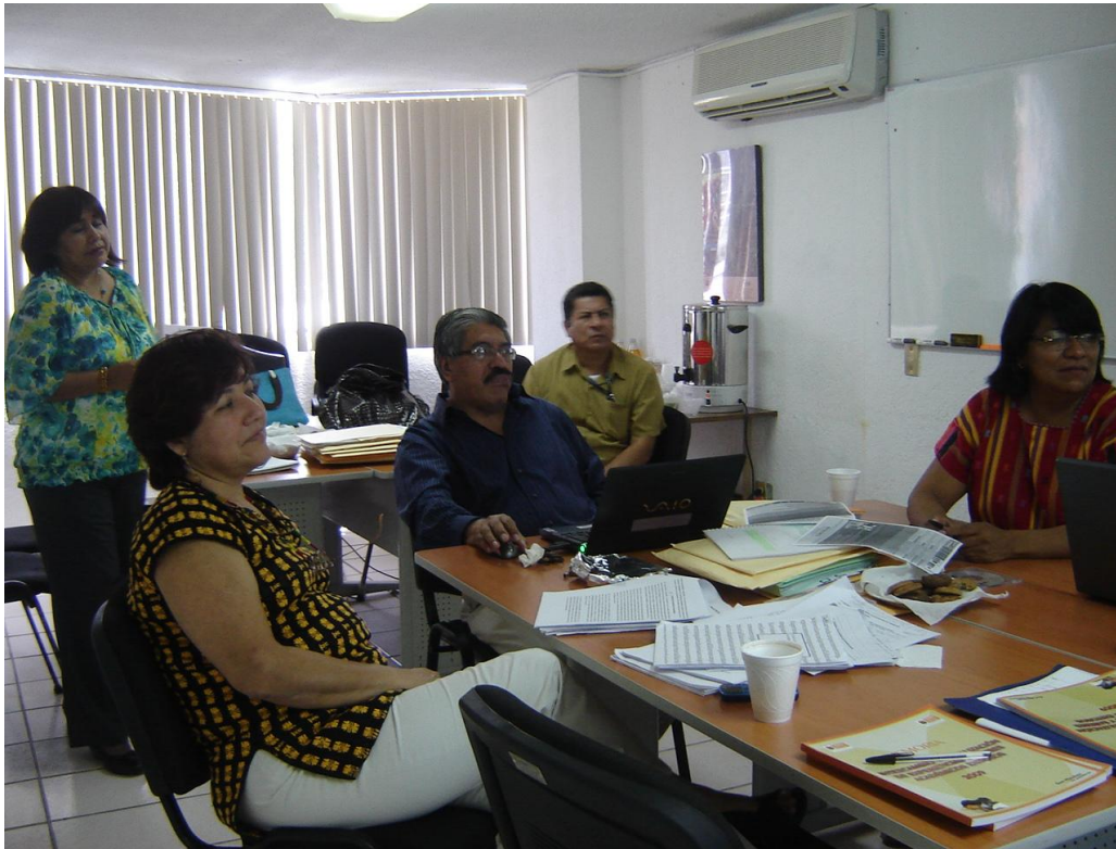
Integrantes del Comité Evaluador revisando un video presentado como evidencia.