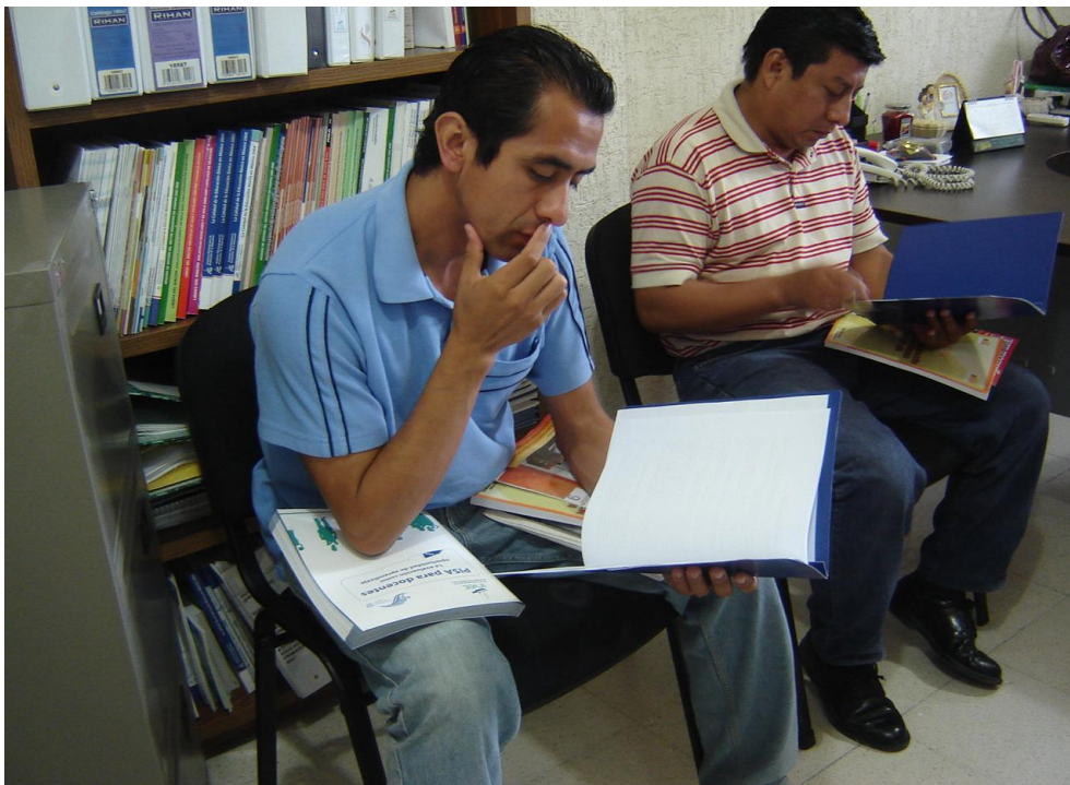
Autores de los trabajos ganadores revisando los informes oficiales emitidos por el Comité Evaluador.