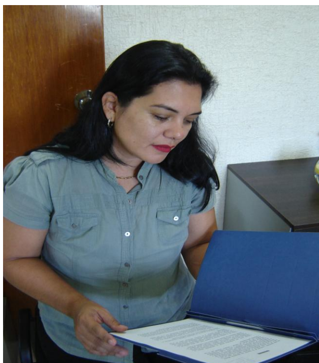
Autoras de los trabajos ganadores revisando los informes oficiales emitidos por el Comité Evaluador.