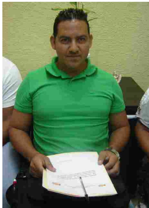
Autores de los trabajos seleccionados, revisando los informes oficiales emitidos por el Comité Evaluador.