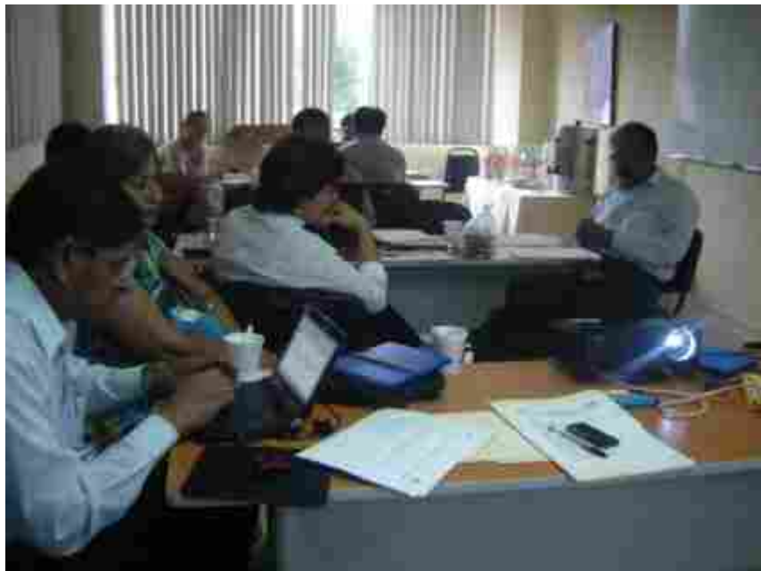
Revisión de trabajos participantes, por parte del Comité Evaluador.