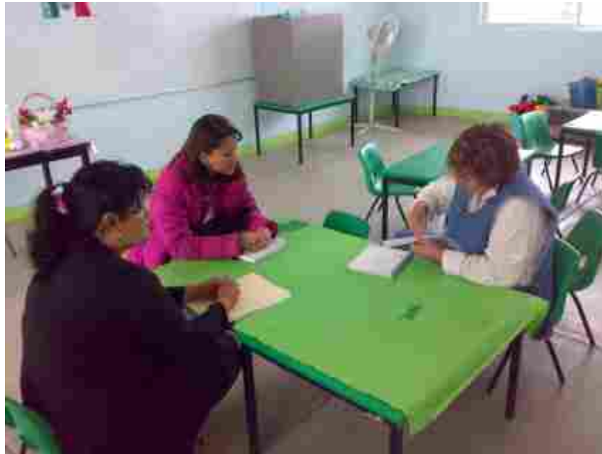
Reunión con la Directora encargada del Jardín de niñas y niños “Diego Rivera”, Clave 07DJN2128S, Cintalapa de Figueroa, Chiapas.