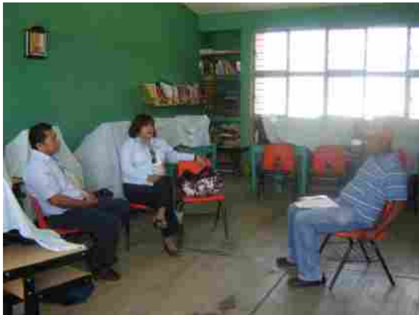
Reunión con el Director de la escuela Primaria Bilingüe “Mariano Escobedo” Clave 07DPB2758W Venustiano Carranza, Chiapas.