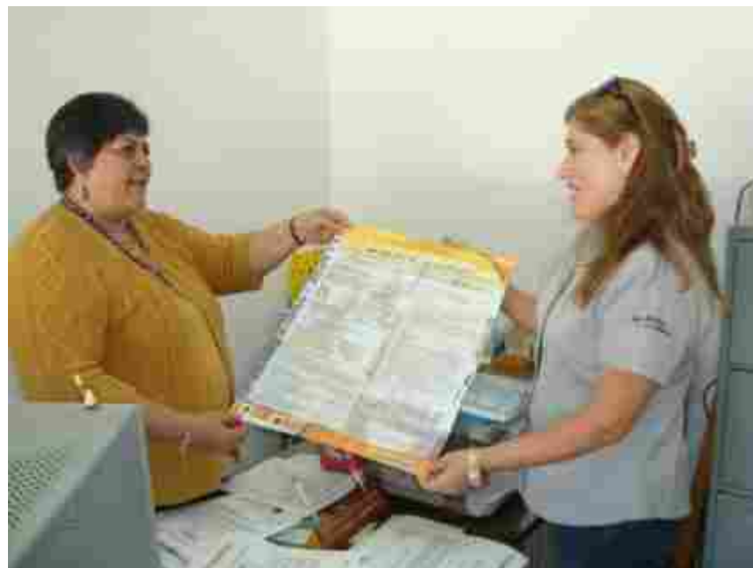
Entrega de la Convocatoria a la directora del Centro Educativo Particular “Bertha Von Glumer” Clave 07PES0216N, San Cristóbal de Las Casas, Chiapas.