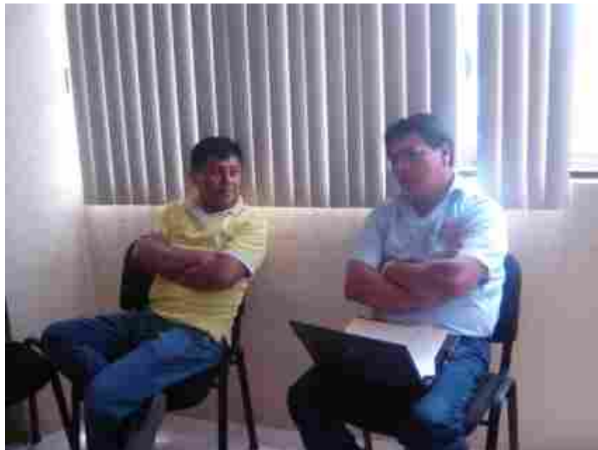
Integrantes del Comité Evaluador, emitiendo comentarios de los tres mejores trabajos.