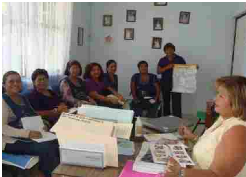
Reunión con docentes del Jardín de Niñas y Niños “Esperanza Castellanos” Tuxtla Gutiérrez, Chiapas.