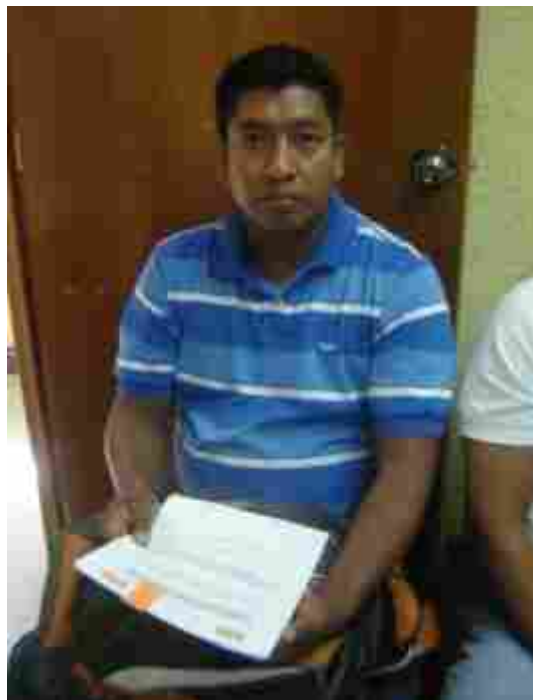
Autores de los trabajos seleccionados, revisando los informes oficiales emitidos por el Comité Evaluador.