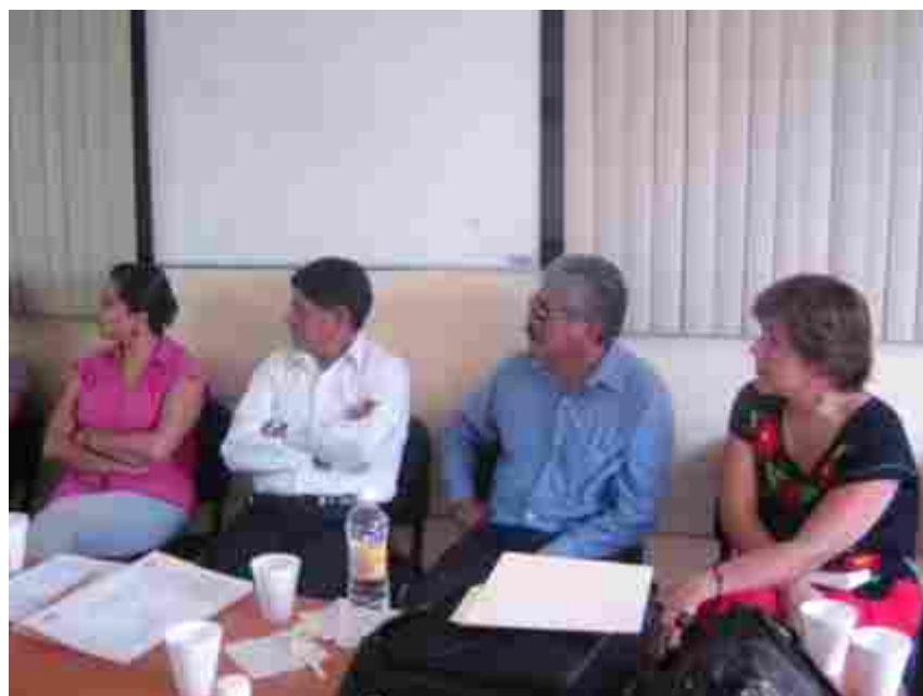
Integrantes del Comité Evaluador, Seleccionando los tres mejores trabajos.