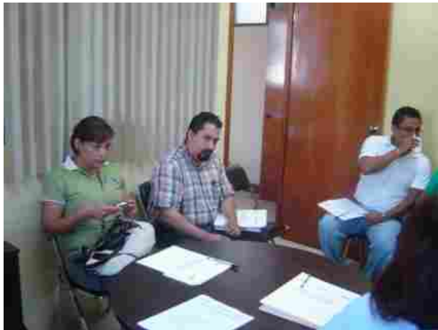
Autores de siete trabajos seleccionados en escucha de las felicitaciones