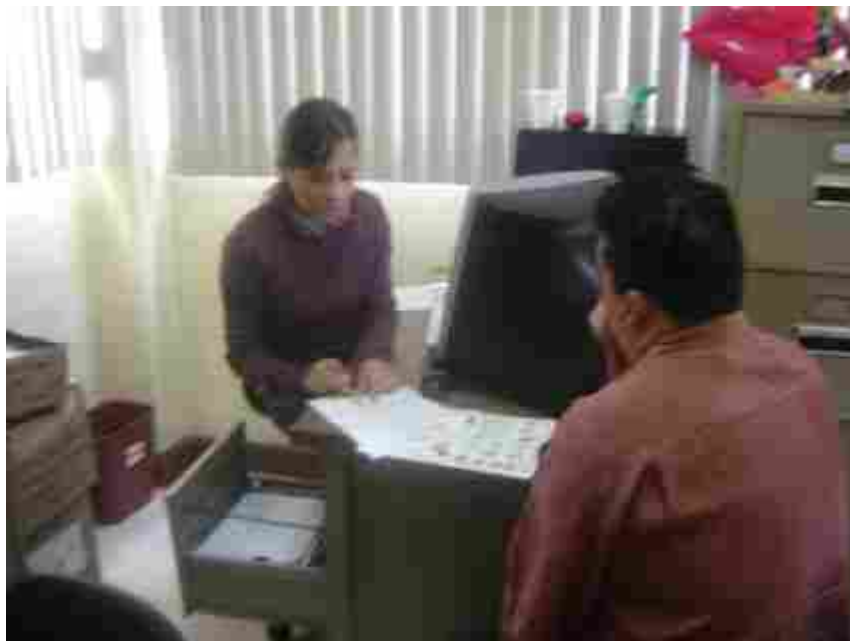
Personal de la Dirección de Calidad e Innovación Educativa, en la recepción de trabajos participantes.