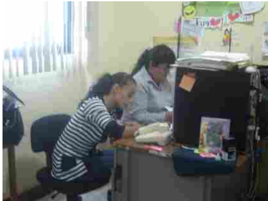
Personal de la Dirección de Calidad e Innovación Educativa, en la recepción de trabajos participantes.