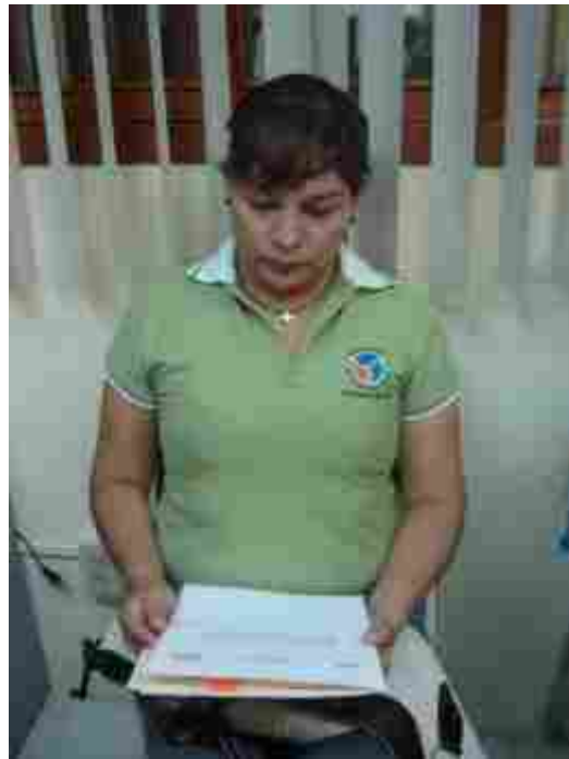
Autores de los tres mejores trabajos, revisando los informes oficiales emitidos por el Comité Evaluador.