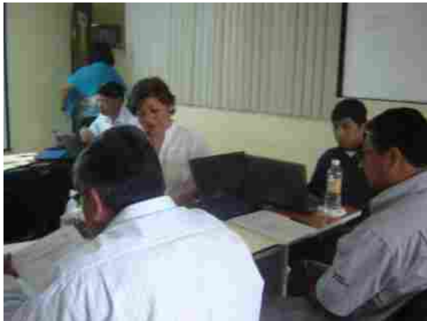
Revisión de trabajos participantes, por parte del Comité Evaluador.