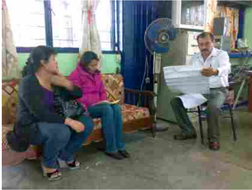
Reunión con el Director de la Escuela Primaria Federalizada “Año de Juárez”, turno vespertino, Clave 07DPR1305P, Ocozocoautla de Espinosa, Chiapas.