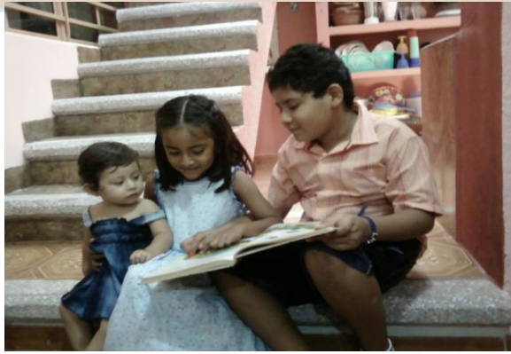
En casa, los niños mayores deben leer textos a los más pequeños.