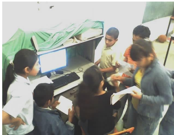
La lectura con onomatopeya.